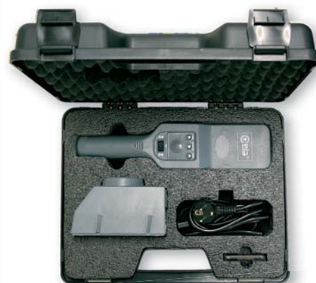
ТРАНСПОРТИРОВОЧНЫЙ КЕЙС V140